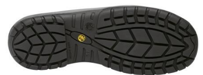
Suela Antiestática + Resistente a los hidrocarburos